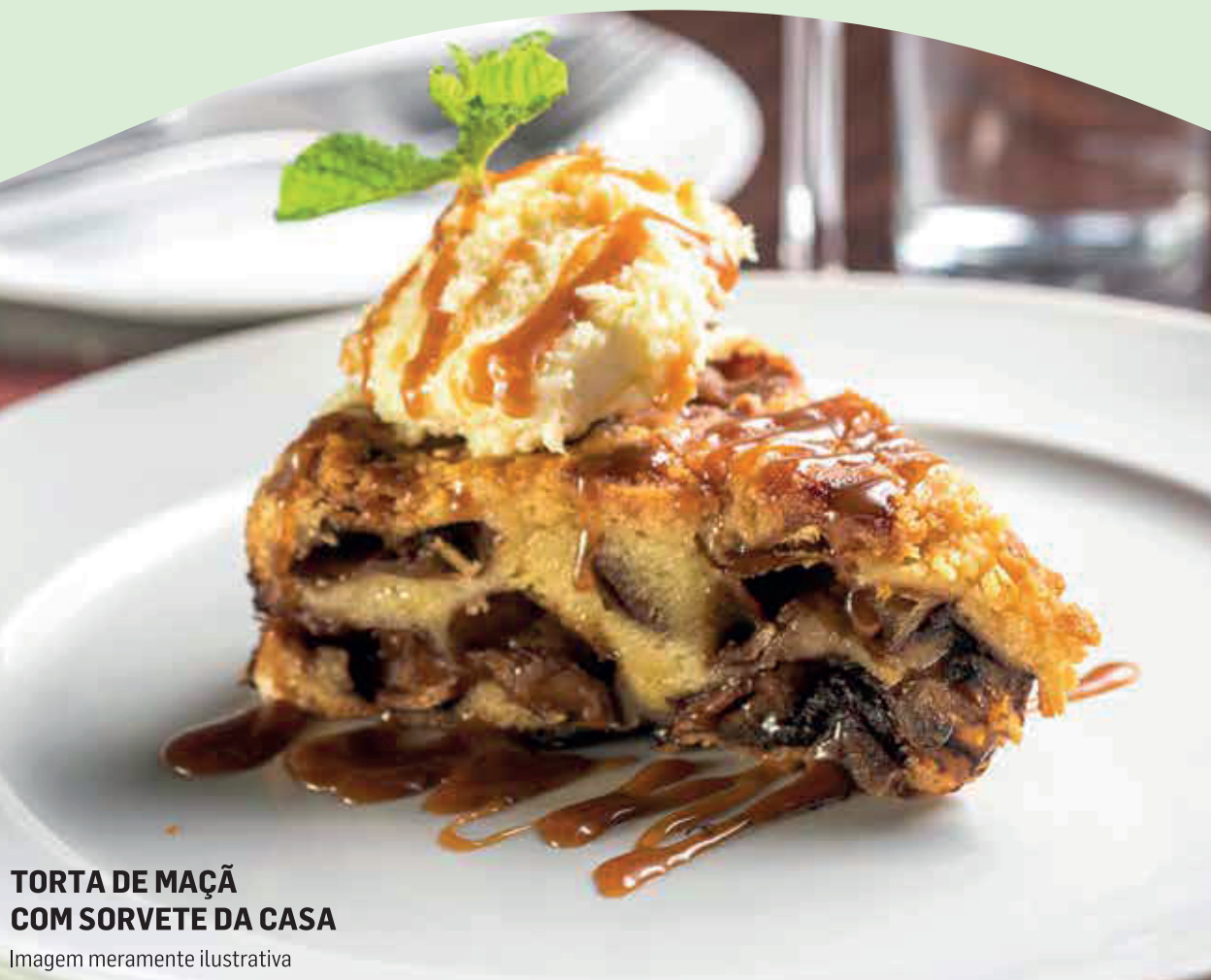
TORTA DE MAÇÃ COM SORVETE DA CASA

Que tal um docinho para finalizar? Consulte nossas opções de sobremesas!